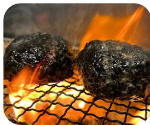
特製 ミニ炭バーグ