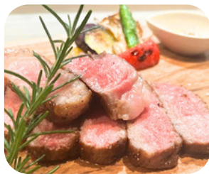
黒毛和牛サーロイン