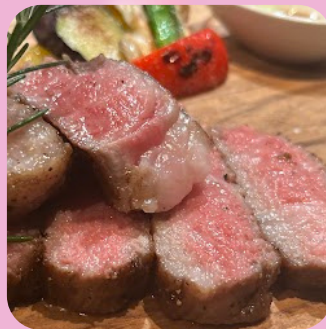
黒毛和牛サーロイン